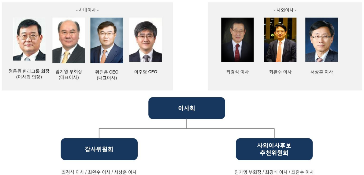
<그림2. 이사회 및 위원회 구성>